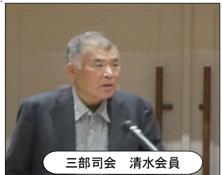
三部司会 清水会員