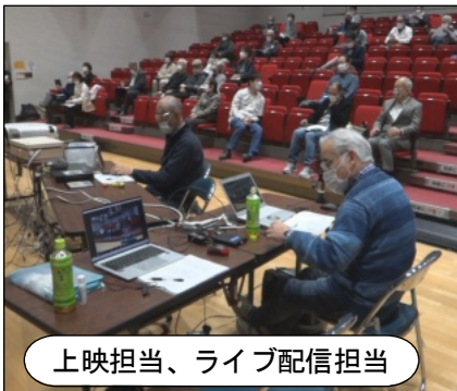
上映担当、ライブ配信担当