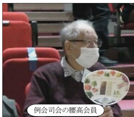
例会司会の腰高会員