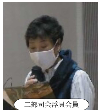
二部司会浮貝会員