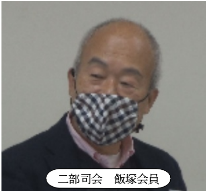
二部司会 飯塚会員