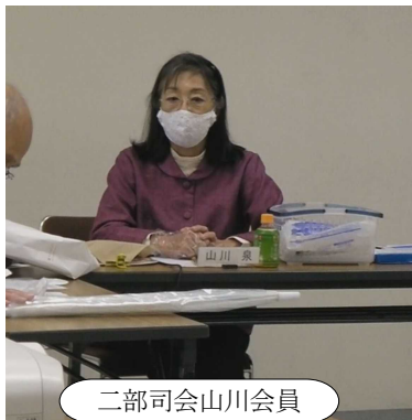
二部司会山川会員