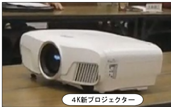
4K新プロジェクター