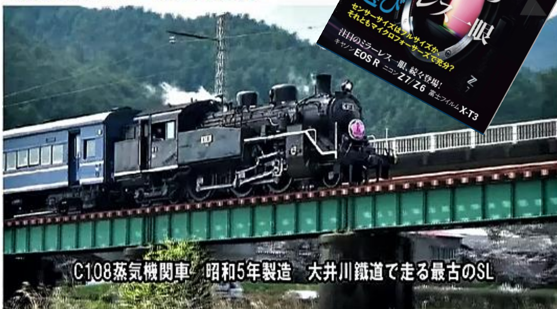
C108蒸気機関車 昭和5年製造 大井川鐵道で走る最古のSL