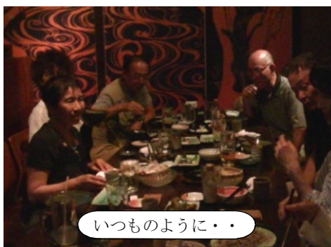
いつものように・・・