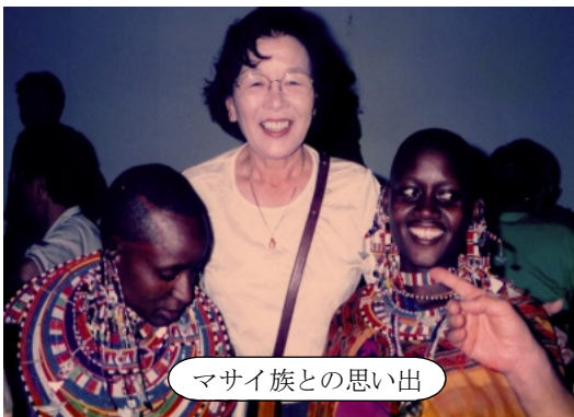
マサイ族との思い出

に立ちほだかり牙を向けられ恐怖。マサイ族との交流も忘れられない思い出です。黄金色に輝く夕日が地平線に沈む瞬間は泣いてしまいました。南十字星も輝いていました。あの頃はまだビデオをやっていませんでしたが、やっていたら、素晴らしい感動が残せたのに。残念。