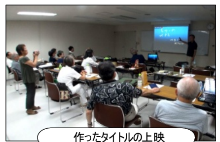
作ったタイトルの上映

ビデオ講習会大盛況 映像802が発足して初となるビデオ講習会が六月二十二日、八王子労政会館にて開かれました。この日は朝からあいにくの雨模様。参加者の出足が心配されましたが、開いてみると当日の参加申込者も含めて十三名の受講者が集まりました。事務局の高橋会員からエディウス・ネオ3を用いたビデオ編集の概略説明のあと、その体験版を各自のパソコンにインストール。持ち寄った素材で編集が始まると、会のスタッフ十名も大わらわ。 それでも午後二時過ぎには全員が編集を終え、視聴することに。旅行記ありホームビデオあり、会社のプロモーションビデオまでが……。とても初めてとは思えない作品の数々は例会に臨んで居ると見まがうばかりの出来上がりぶり。講習会を企画した会スタッフも大いに楽しませていただきました。