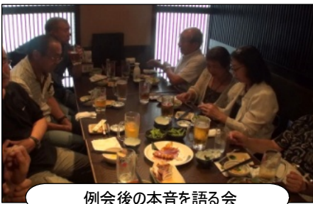
例会後の本音を語る会