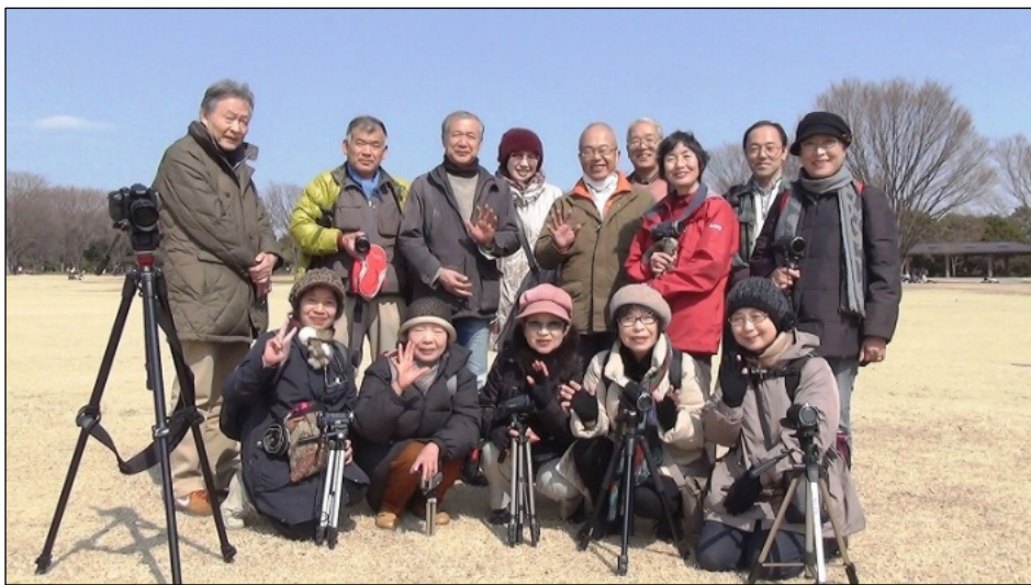
参加者全員で記念写真